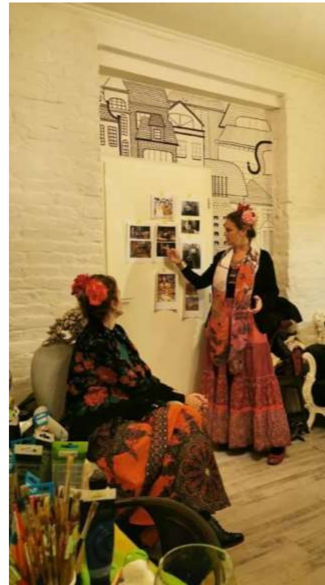
“RADIONICA “SLIKANJE I VINO”