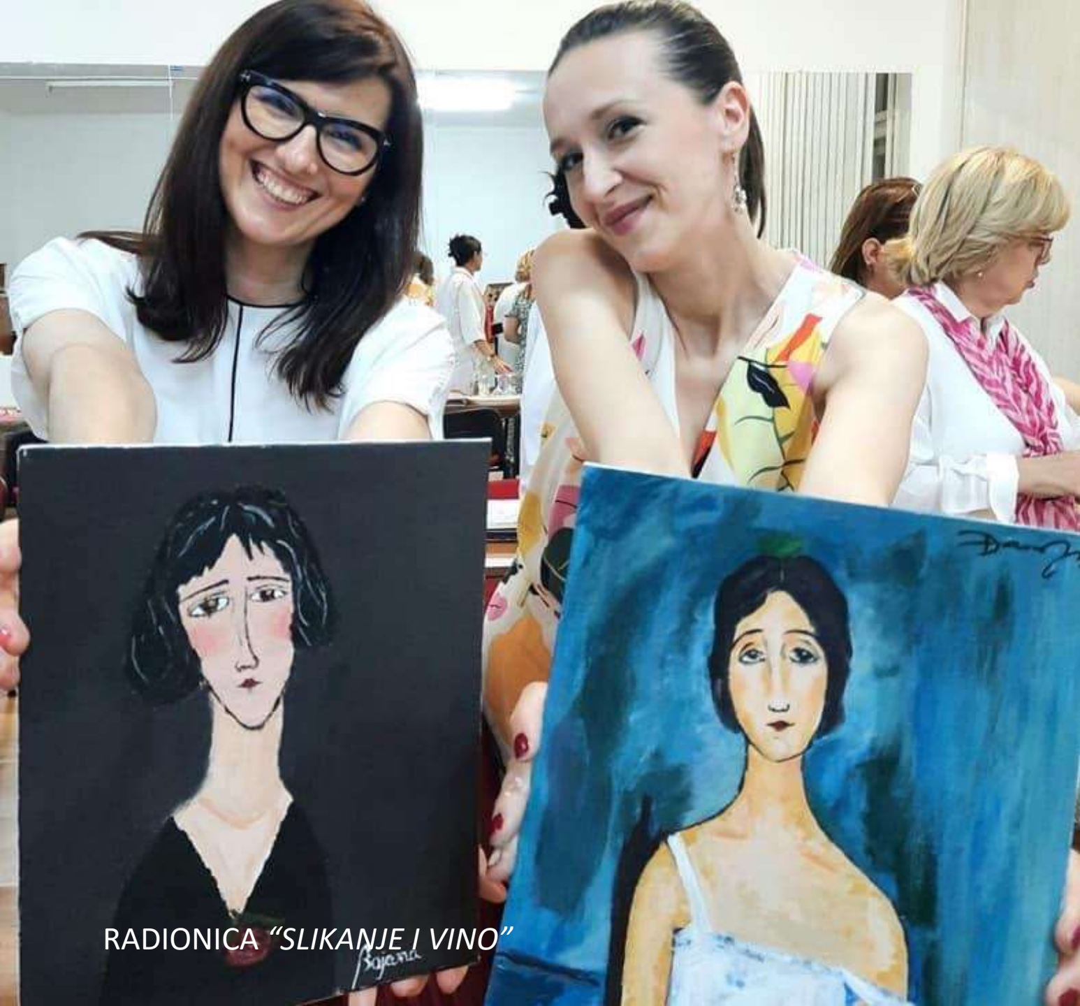
RADIONICA "SLIKANJE I VINO"