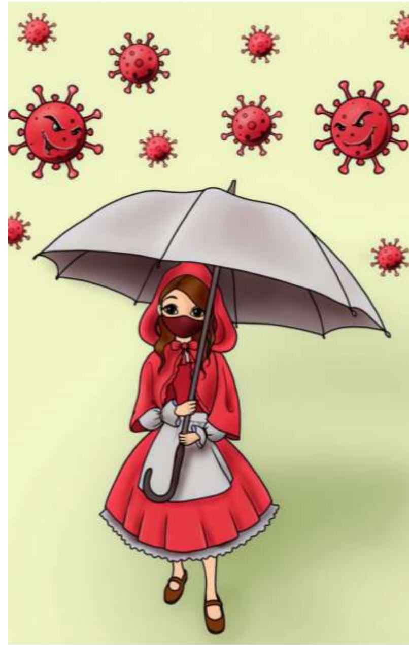
JUUMS Građevinsko-geodetska škola I Zavod NALAZ